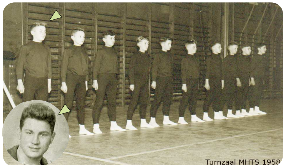
Turnzaal MHTS 1958

De turnploeg van de MHTS Aalst in 1958 - uiterst links -en inzet- voorman en auteur van dit artikel