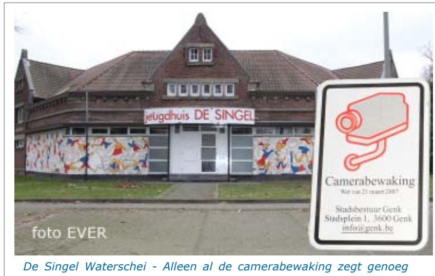
De Singel Waterschei - Alleen al de camerabewaking zegt genoeg